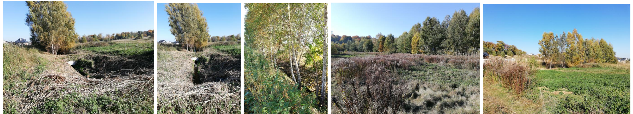
OBSZAR NR 1