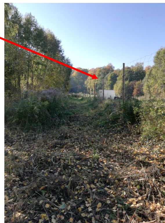
OBSZAR NR 1